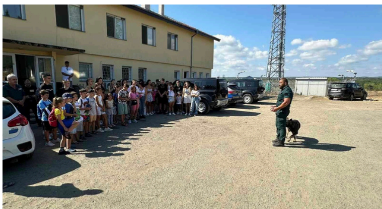
Запознаване на деца с работата на граничните полицаи

За първи път децата посетиха ГПУ- Резово . Запознаха се отблизо с дейностите на служителите на ГД "Гранична Полиция" по време на изпълнение на служебните си задължения, както и какви са действията със служебно куче при задържане на нарушител.